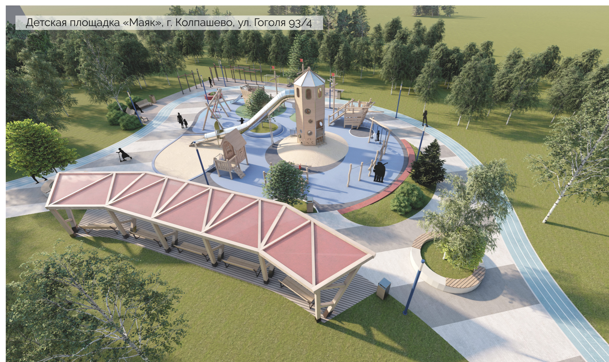
Детская площадка «Маяк», г. Колпашево, ул. Гоголя 93/4