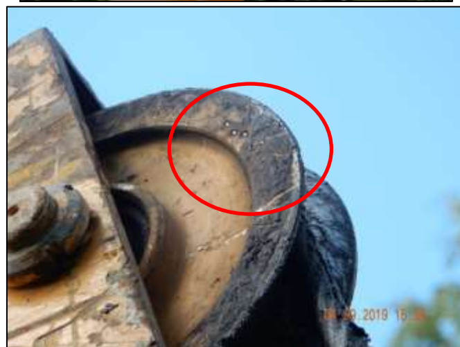
Место замыкания ВЛ-10 кВ л. 282-08 на металлоконструкцию БКМ

Прибывшая по вызову очевидцев бригада скорой медицинской помощи констатирована смерть электромонтажника.