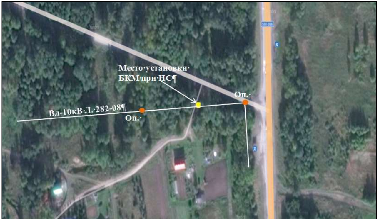
Пролёт опор № 105-106 ВЛ-10 кВ филиала ПАО «МРСК Северо-Запада» «Псковэнерго»